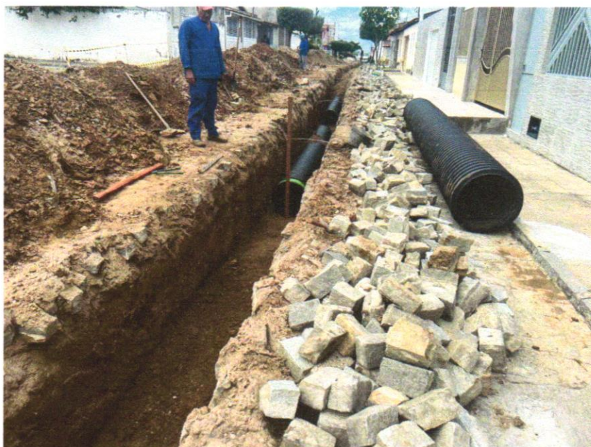
Foto 14 - FORNECIMENTO E ASSENTAMENTO DE TUBO CORRUGADO PAREDE DUPLA PEAD, D = 600 MM (24"), PARA SISTEMAS DRENAGEM, TIGRE - ADS N-12