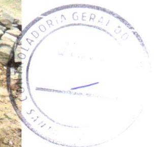
Foto 04 – ESCAVAÇÃO MANUAL DE VALA COM PROFUNDIDADE MENOR OU IGUAL A 1,30 M

Evaldo Almeida Moraes Evaldo Almeida Moraes Engenheiro Civil RNP 051417303-3