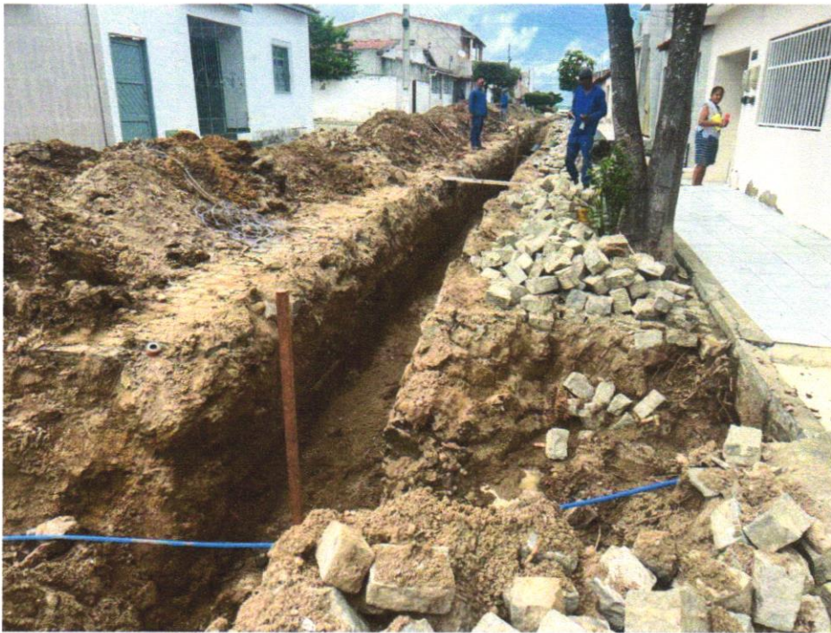
Foto 05 - ESCAVAÇÃO MECANIZADA ATÉ 1,50M EM MATERIAL DE 1º CATEGORIA PARA ABERTURA DE CORTE PARA ATERRO, SEM BOTA FORA