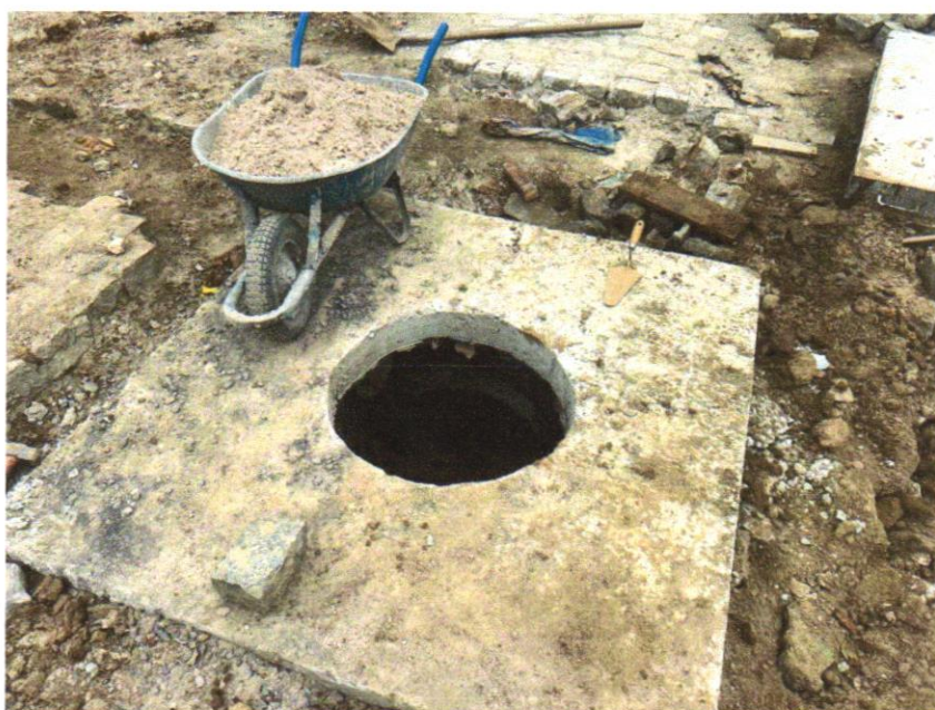
Foto 12 – FORNECIMENTO E ASSENTAMENTO DE TUBO CORRUGADO PAREDE DUPLA PEAD, D = 300 MM (12"), PARA SISTEMAS DRENAGEM, TIGRE - ADS N-12