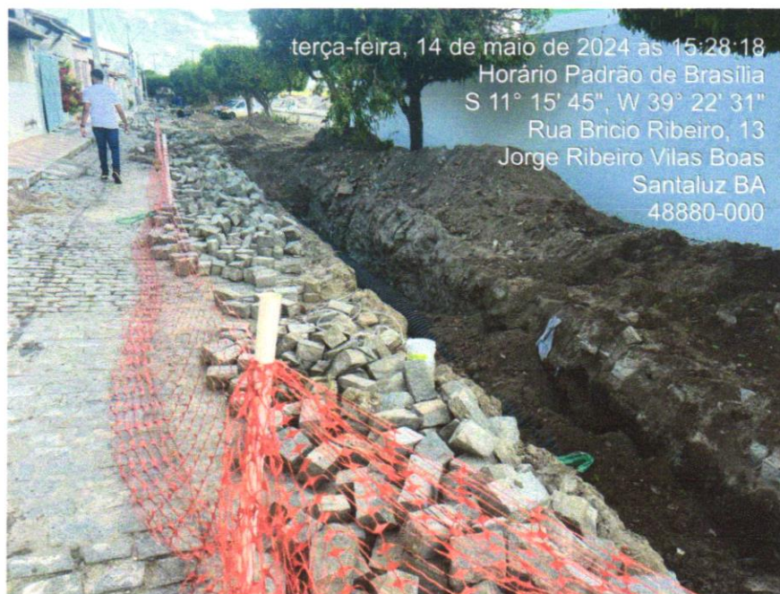
Foto 01 - Tapume de proteção em tela de polietileno h=1,20 com bloco de concreto