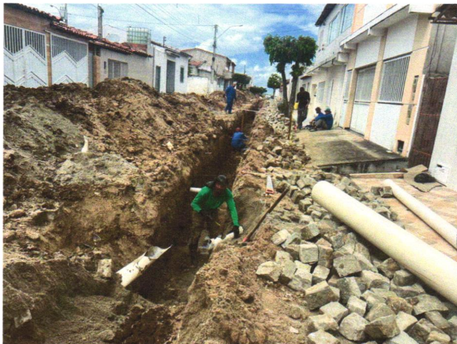
Foto 06 - ESCAVAÇÃO MECANIZADA ATÉ 1,50M EM MATERIAL DE 1º CATEGORIA PARA ABERTURA DE CORTE PARA ATERRO, SEM BOTA FORA