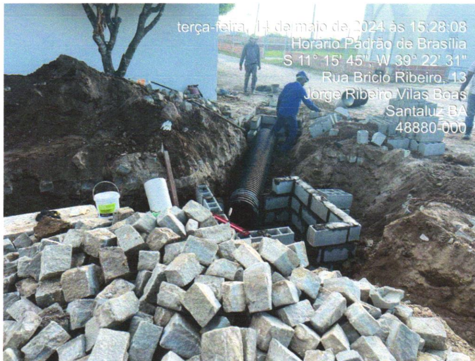
Foto 13 - FORNECIMENTO E ASSENTAMENTO DE TUBO CORRUGADO PAREDE DUPLA PEAD, D = 450 MM (18"), PARA SISTEMAS DRENAGEM, TIGRE - ADS N-12