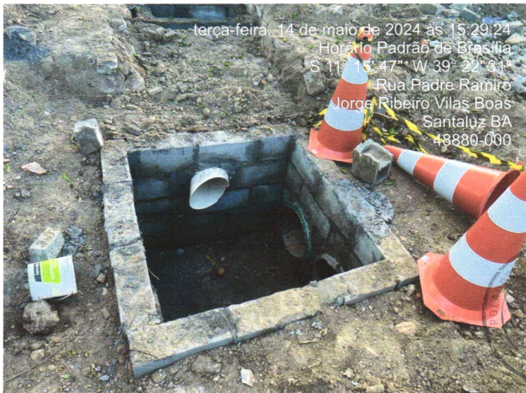
Foto 16 - TUBOS