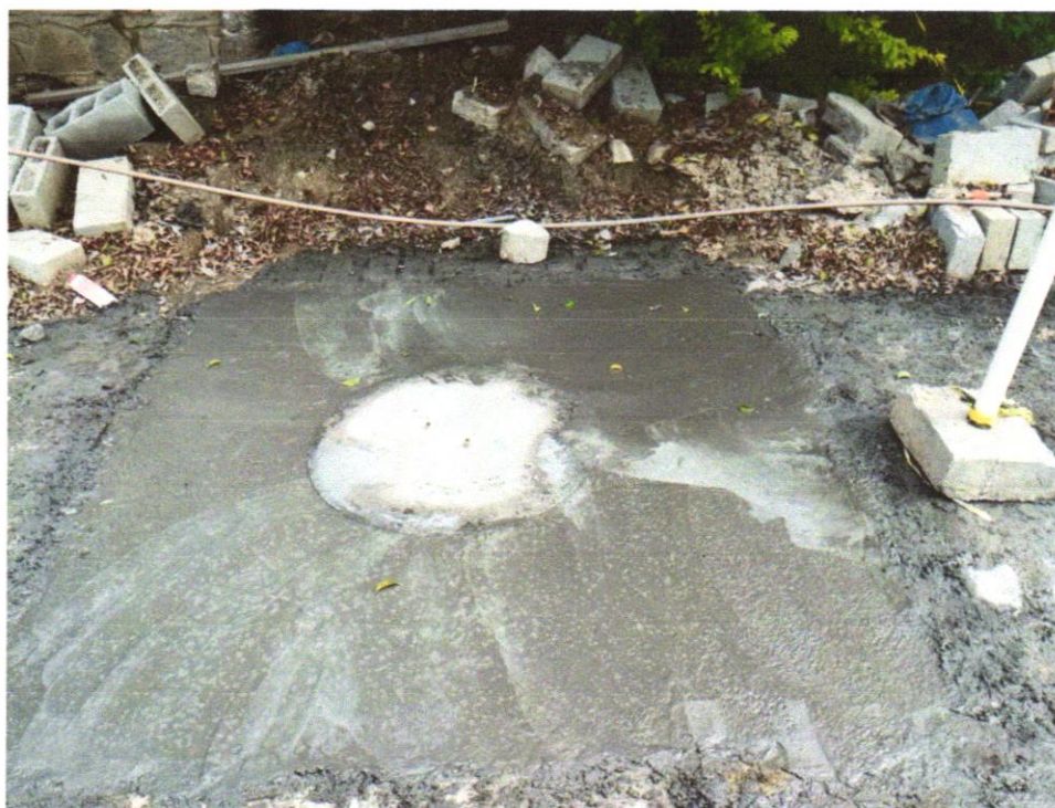
Foto 11 – CONCRETO FCK = 25MPa, TRAÇO 1:2,3:2,7 (EM MASSA SECA DE CIMENTO/ AREIA MÉDIA/ BRITA 1) - PREPARO MECÂNICO COM BETONEIRA 600 L. AF_05/2021