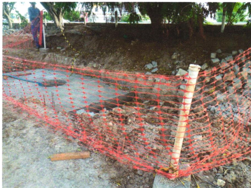
Foto 02 - Tapume de proteção em tela de polietileno h=1,20 com bloco de concreto