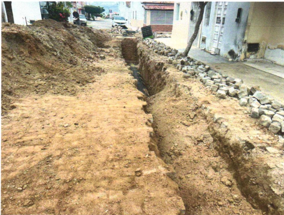
Foto 07 - ATERRO MANUAL COM SOLO ARGILO-ARENOSO IMPORTADO E COMPACTAÇÃO MECANIZADA EM CAMADAS DE 0,20 M NO MÁXIMO